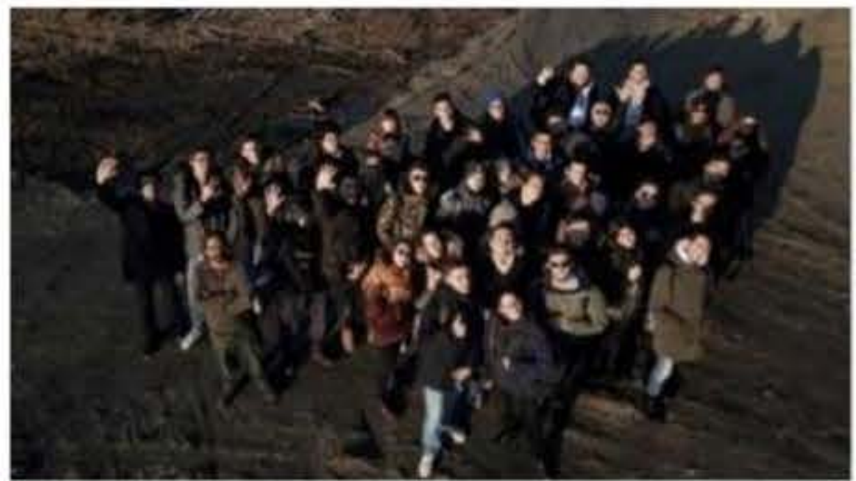
CLICCA PER INGRANDIRE +

(ANSA) - MILANO, 30 MAG - Gli studenti disegnano un futuro anti-droga con 'Smart Park 4.0', un concorso di idee per la riqualificazione del boschetto di Rogoredo - un luogo storico di spaccio di stupefacenti nel quartiere sud milanese frequentato da centinaia di tossicodipendenti nonostante i continui controlli delle forze dell'ordine - che ha coinvolto 49 allievi di 43 scuole superiori in tutta Italia.